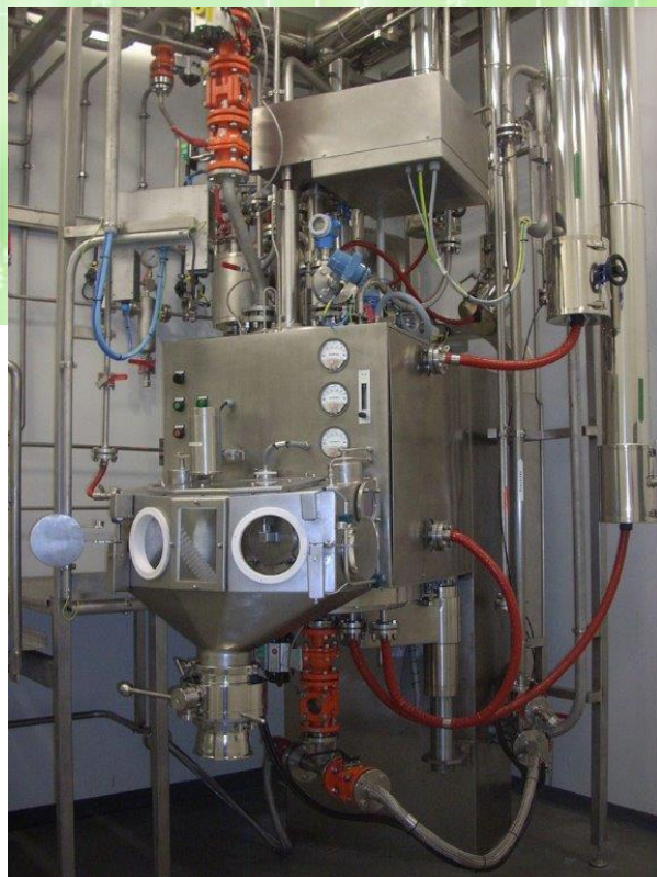
↑ Filtre sécheur Nutsche agité